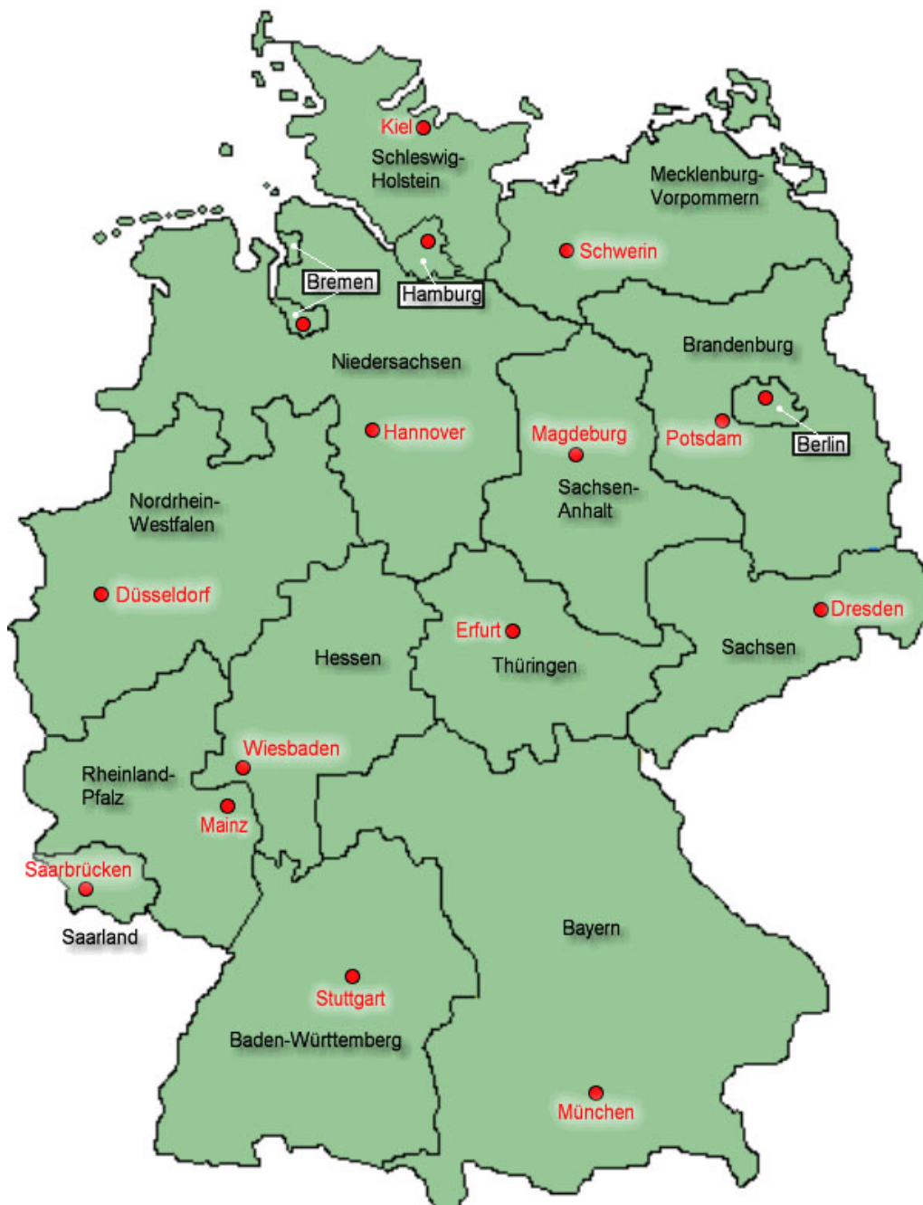
Abbildung 2: Vorschlag einer bundesweiten Vernetzung von Anlaufstellen für ehemalige Heimkinder

ratungsstelle zu diesem Problemkreis. Nach telefonischer Auskunft von Experten in diesem Arbeitsbereich wurden in den vergangenen sechs Monaten (von Mai bis Oktober 2009) 300-400 Kontakte mit Heimkindern, Angehörigen und ehemaligen ErzieherInnen entgegen genommen und versorgt. Die informellen und unbürokratischen Strukturen haben sich bewährt, das Angebot war allerdings bei Weitem nicht in der Lage, den bundesweiten Bedarf abzudecken. Alleine der Schriftverkehr im Zuge der Anfrage an den Petitionsausschuss, der aufkommenden Fragen mit den politischen Entwicklungen und des medialen Informationsflusses überforderte die Kapazitäten des einzigen Angebots bundesweit.